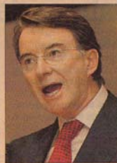
Peter Mandelson, comisario europeo de Comercio.

El comisario europeo de Comercio, el británico Peter Mandelson, ha advertido que en ocasiones las medidas antidumping pueden perjudicar también a las empresas europeas que producen en los países castigados. El ejemplo más reciente ha sido la prórroga por un año de los aranceles que se aplican a las bombillas de bajo consumo fabricadas desde China. Tras una dura campaña a